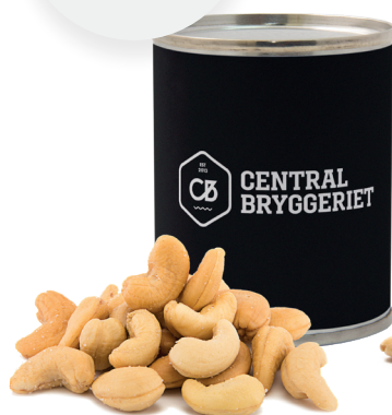
Cashewnötter 50 g