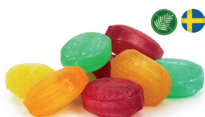
Fruktblandning Minsta beställning 30 kg med egen design.

Nettovikt: 4,7 g Minsta beställning: 5 kg