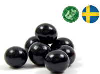
Svart & Salt (Lakrits dragerad med mjölkchoklad med smak av kola)

Nettovikt: 5,5 g Minsta beställning: 5 kg