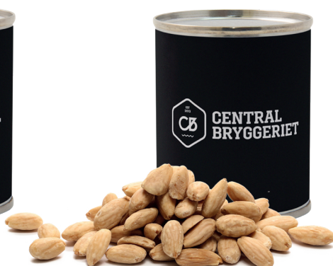
Rostade Mandlar 50 g