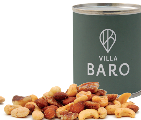
Cocktailnötter 50 g