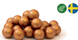
Salt kolalakrits (Lakrits dragerad med mjölkchoklad, havssalt och med smak av kola)