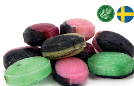
Saltblandning (pulver) Minsta beställning 30 kg med egen design.